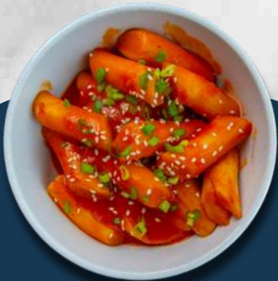
TTEOBOKKI (RICE CAKE) 떡볶이