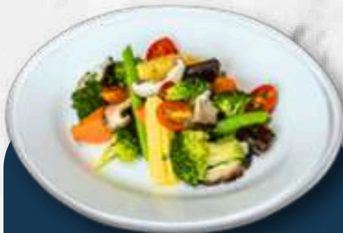
BUTTER VEGETABLES 채소 볶음

Sautéed vegetables with butter. 버터에 볶은 채소.