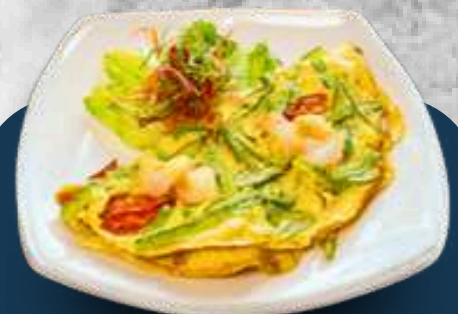
Fried Egg with Bitter Melon and Shrimps

계란과 새우를 곁들인 여주 볶음 Bitter melon cook with shrimp and eggs. 여주를 새우와 계란과 함께 조리