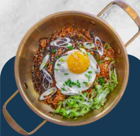
KIMCHI BOKKEUMBAP 김치 볶음밥

Rice ,egg ,ground beef,kimchi & gochujang 밥, 계란, 다진 소고기, 김치, 고추장