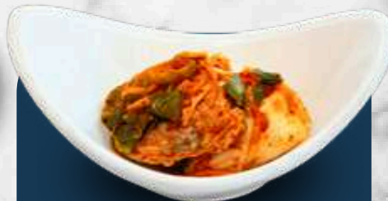
KIMCHI CABBAGE 김치

Traditional Korean salted vegetables. 전통 한국식 절인 채소.